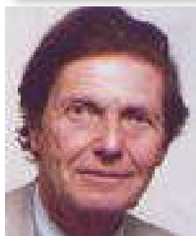
Conseiller à la Présidence de la République française pour l'Union pour la Méditerranée (UPM)

L'UPM suscite de nombreuses inquiétudes au sud du Sahara sur les risques que le projet fait porter à l'aide publique au développement du continent noir.