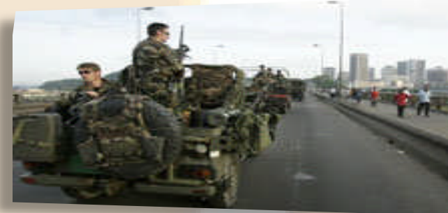
Militaires français du 43 ème BIMA (Abidjan)

Ce sont les forces envoyées pour des missions particulières de sécurité, parfois courtes parfois durables, à la demande des autorités des pays concernés, où par mandat des Nations Unies. Au Tchad, il