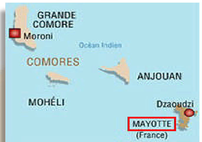
101 ème département français

Il est à prévoir que l'île de la Réunion va devenir une sorte de « tuteur » dans cette