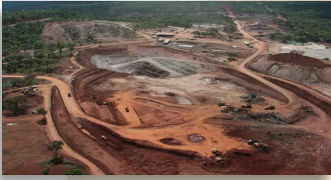
Mine du Katanga

(suite)... Pendant longtemps, la GECAMINES, seule entreprise d'Etat chargée de l'exploitation et de la commercialisation des minerais de cuivre et de cobalt du Katanga, représentait 70% des recettes du budget de l'Etat et a permis la modernisation de la province et de grandes villes; Kipushi, Kolwezi, Likasi et Lubumbashi.