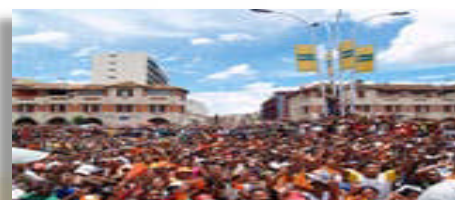
Manifestation à Antananarivo