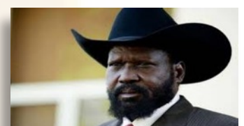
Salva Kiir, dirigeant du Sud-Soudan

L'hostilité de Washington au régime musulman de Khartoum ne pousse pas le nord et le Sud-