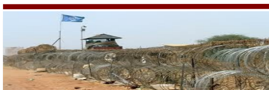
Frontière entre le Nord et Sud Soudan

Les relations sont donc compliquées entre les populations de cette région et le nouveau pouvoir au Sud-Soudan appuyé sur l'ethnie dominante des Dinkas, sans omettre