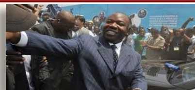
Ali Bongo Ondimba à Libreville

ajoutée. Il s'agit plus largement de diversifier l'économie nationale, en mettant notamment l'accent sur les activités de service dont le développement comme d'ailleurs celui des industries ira de pair avec la valorisation des ressources humaines du Gabon, à travers l'enseignement et la formation technique. L'objectif est de développer des pôles de référence, notamment dans les services financiers, les nouvelles technologies de l'information, les métiers de la santé, de l'enseignement supérieur et de l'économie verte.../