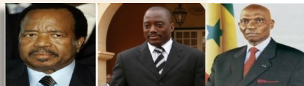
Paul Biya, Joseph Kabila, Abdoulaye Wade

se au premier tour au « ticket » qui obtiendrait 25% des suffrages. Mais devant les violentes manifestations suscitées par ce projet de réforme, le Président Wade y a renoncé. Il a peu après envisagé d'avancer l'élection présidentielle à l'automne, puis devant les protestations n'a pas donné suite. Les opposants susceptibles de se porter candidats sont nombreux, ce qui entraîne pour eux ou en tout cas pour certains d'entre eux, la nécessité de s'unir. Parmi les candidats nationalement et internationalement les plus en vue, figurera probablement Jacques Diouf, ancien ministre du Président Senghor, et actuel et très remarquable directeur général de la FAO.