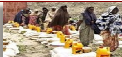
Famine en Somalie

Les gouvernements comme les organismes de coopération à l'étranger ont trouvé plus simple de s'intéresser à la création de grandes entreprises très souvent publiques ou parapubliques et davantage orientées vers