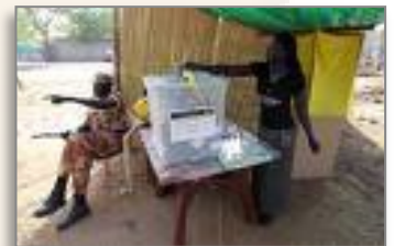
Vote au sud-Soudan en Janvier 2011

La région autonome du Sud Soudan actuellement présidée par Silva KIIR, entretient de bons rapports avec l'Ethiopie et l'Erythrée, qui l'ont soutenue pendant la guerre civile. Du côté