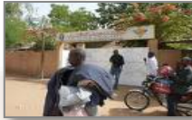
Niamey - Niger