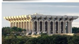
Palais d'Etoudi, Présidence de la République du Cameroun