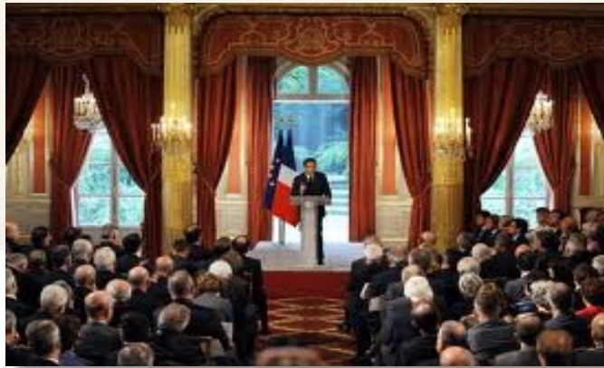
Discours du Président de la République, Nicolas Sarkozy à l'occasion de la XIX ème conférence des ambassadeurs le 31 août dernier à l'Élysée

Le Ministre a ensuite souligné le rôle de la France en Libye. Il a, dans le même sens, loué l'efficacité des sanctions européennes qui ont joué « un rôle décisif dans la chute de Laurent Gbagbo ». Revenant sur l'engagement de la France aux côtés du continent africain, il a poursuivi en ces termes : « Je fais partie de ceux qui croient en l'avenir de l'Afrique et aux liens d'amitié entre la France et l'ensemble des pays africains ». ... « Les défis sont connus, a poursuivi le Ministre en citant le défi alimentaire ; le défi de la démocratie ; le défi économique ; le défi diplomatique », qu'il faut relever pour permettre à l'Afrique de mieux faire entendre collectivement